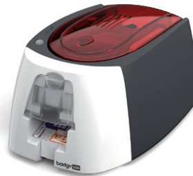
Imprimante à cartes Badgy